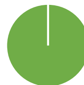
Einzelkunden mit Ökostromlieferungen; Stromtankstellen - Referenzjahr 2022